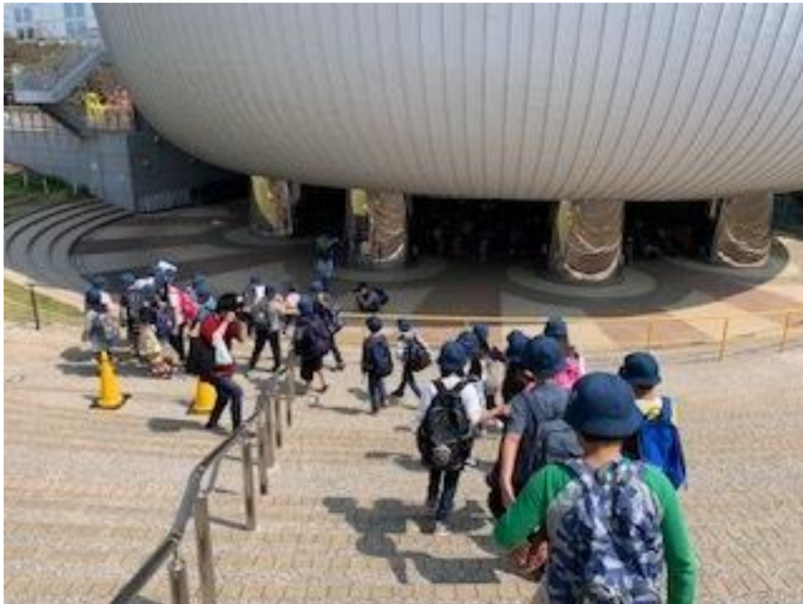
多摩六都科学館にて（3・4年生遠足）

四月十九日（金）に三、四年生が多摩六都科学館に遠足に行きました。出発式の時から三、四年生混合の班に分かれ、四年生がリーダーシップをとりながら指示を出したり、班を並べたりということを行いました。館内でもその班のまま行動し、時折迷子になる班員に心を配りながら上手に回ることができました。もちろん、三年生も四年生に協力するという態度をきちんとできたので、全体として整然と見学ができたのだと思います。四年生にとっても、三年生にとっても、高学年になる前に「自分たちで考えて行動する」というよい経験ができたのではないかと思います。 その行動のベースには、「人の役に立とうと思う」心があ