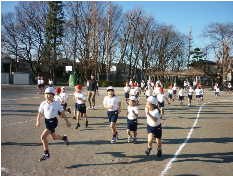
寒い朝、元気に走る子供たち (マラソン朝会)