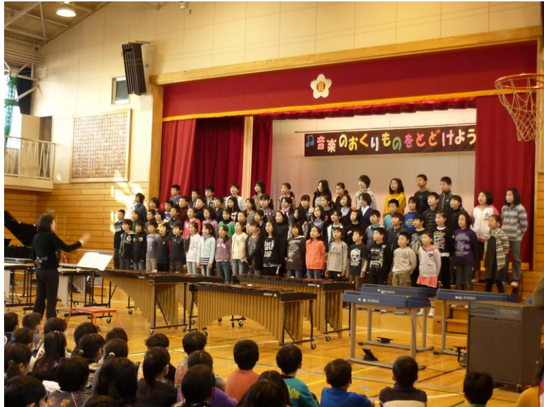
歌声を響かせて（音楽会）

立春は過ぎたものの、まだまだ寒い日が続いています。それでも、学校農園の畑では、背の低い野草が地面に張り付くように、緑の葉を成長させています。 誰も教えなくても、春の訪れが近いことを知り、背の低い野草は、大きな野草が育つ前に、精一杯、自分の命を輝かそうとしています。自然の仕組みの素晴らしさに感心させられます。 インフルエンザの流行で延期になった音楽会でしたが、三日間に分けて朝早くからの実施にもかかわらず、多くの方においでいただき、ありがとうございました。 学年、学級閉鎖後、ほとんど練習できない学年もありま