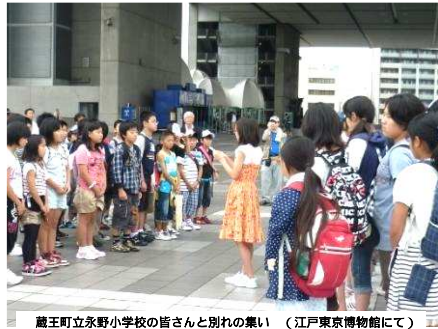
蔵王町立永野小学校の皆さんと別れの集い（江戸東京博物館にて）