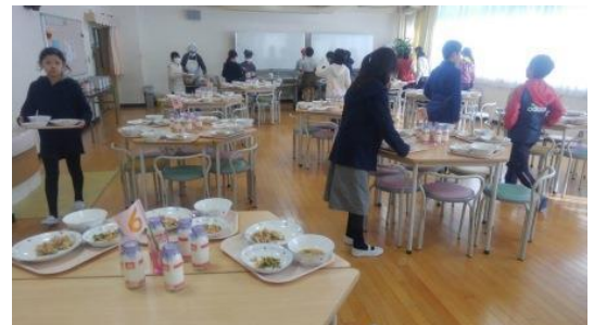
給食準備をする5年生