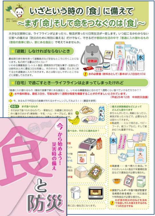
リーフレット いざという時の「食」に備えて 左下の冊子「食と防災」

家族の構成や年齢などで「今の我が家」に必要な物や量は変化していきます。「防災週間」のある9月。この機会に「災害への備え」について考えてみましょう。また、このリーフレットは、練馬区のホームページより「ねりま」の食育に掲載されています。ぜひご利用ください。