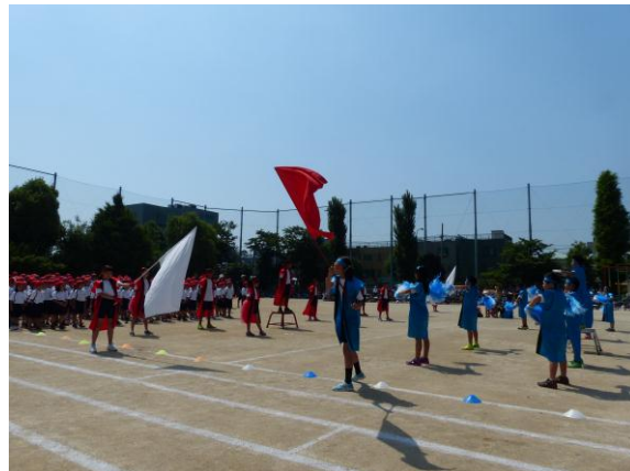
「応援合戦」大きな声を出して