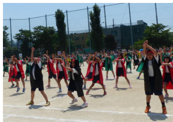
「よさこいソーラン」（3・4年生）