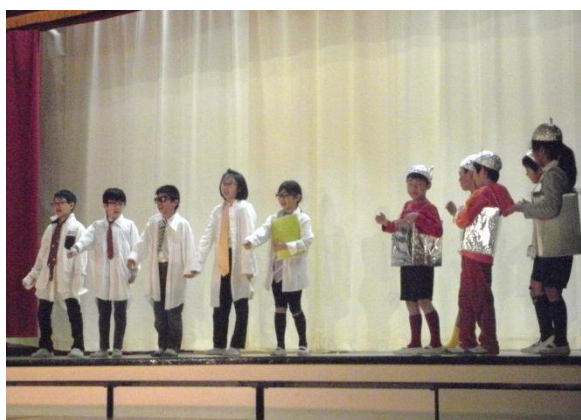
3年 ポロボロボタンとなかまたち