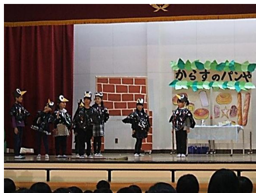
2年 からすのパン屋さん