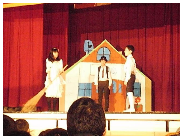
6年 人間になりたがった猫