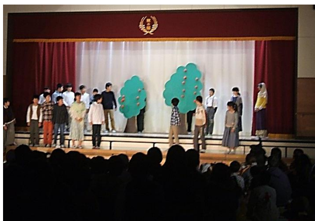
5年 魔法をすてたマジョリン