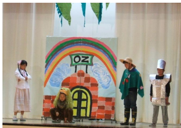
4年 オズの魔法使い