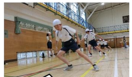
本気モードの6年生。 タタタタ・タタタ タン…