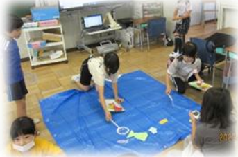
2年1組 どこでもできる楽しい金魚すくい屋さん

各学級、いろいろな意見を出し合って話し合いをしたり、みんなで協力して準備をしたりして本番を迎えました。お店の遊びを通して異学年との交流ができ、笑顔あふれる時間になりました。1年生はお客さんとしてお店を回り、秋の陽まつりを楽しみました。