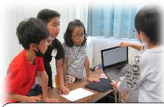
4年1組 めざせ！ 全問正解！クイズ大会！！