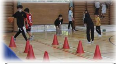
6年1組 ジャンプアスレチック秋の陽 アスリートになろう！