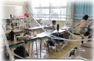
3年2組 くものすくぐれ！ タイムアタック