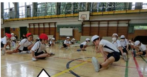
1年生と6年生と一緒に準備運動をしました。

6月9日（金）1～6校時に、体育館で新体カテストを行いました。反復横跳び、立ち幅跳び、上体起こし、長座体前屈の4種目を行いました。6年生と5年生は、1年生と2年生の気持ちを思いやりながら、模範を示したり記録を測定したりしました。頼もしく、優しい5・6年生でした。