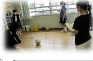
4年2組 ストライクを決めろ！！ わくわくボーリング