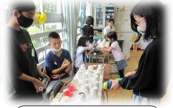
5年1組 ペットボトル空気砲