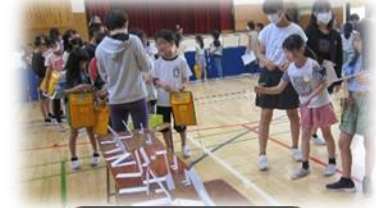
6年2組 秋の陽ゲーム