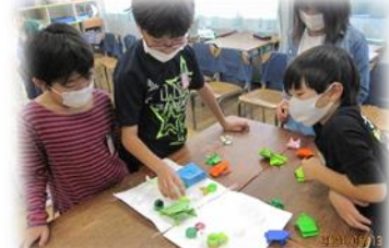
3年1組 ピョコピョンケロケロカエルレース