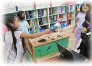
2年2組 モグラキングvs2年2組