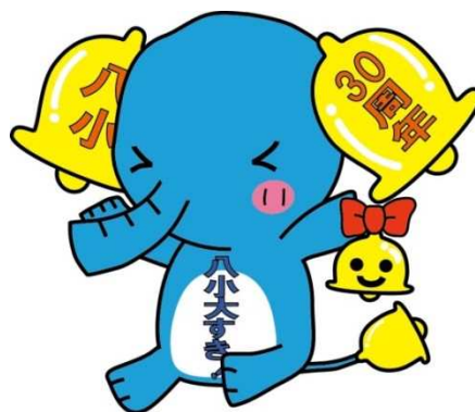
30周年記念キャラクター 「八小がんばるそう」