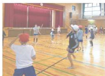
今年度初めての クラブ活動で さっそく熱中!

木々の緑が美しいこの頃ですが、いかがお過ごしでしょうか。学校では、子どもたちも新しい学年になじみ、元気に活動している様子が多く見られます。