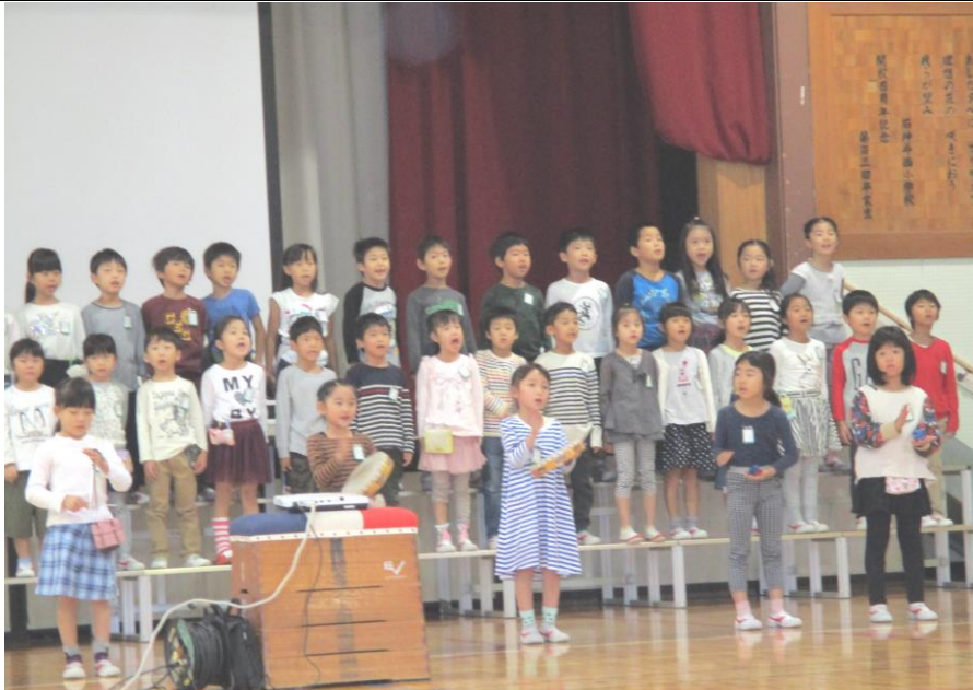
音楽朝会（1年生発表）

今年には九月に台風・大風があり、多くの木々が葉を落としてしまったり、幹や枝が折れたりしました。葉と葉が擦れ合ったために、赤く色づく前に所々が茶色になってしまっているものもあり、残念に思われます。例年ですと今の季節は色とりどりの紅葉が街路樹等にあふれている時期です。