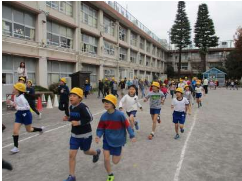
持久走に取り組む石西小の「いだてん」たち

昨年、令和二年は東京オリンピック・パラリンピック大会が開催される年です。昨年、令和二年は東京オリンピック・パラリンピック大会が開催される年です。昨年、令和二年は東京オリンピック・パラリンピック大会が開催される年です。