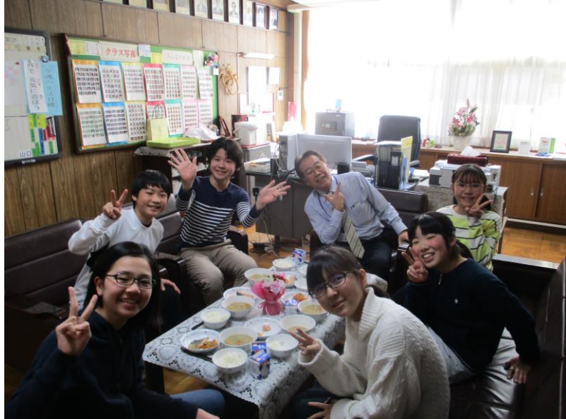
笑顔あふれる6年生との会食