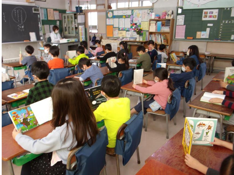
毎週火曜日の朝、読書する子供たち

十一月となり、秋も深まってきました。秋といえば、食欲、スポーツ、そして読書です。先月の体育発表会も終わり、落ち着いて読書をするには最適な季節が訪れました。