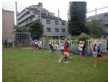
科学クラブ (ペットボトルロケット)

3年生は、来年度から始まるクラブ活動を心待ちにしています。「来年、どのクラブに入ろうかな。」と目を輝かせながら各クラブを見学することと思います。