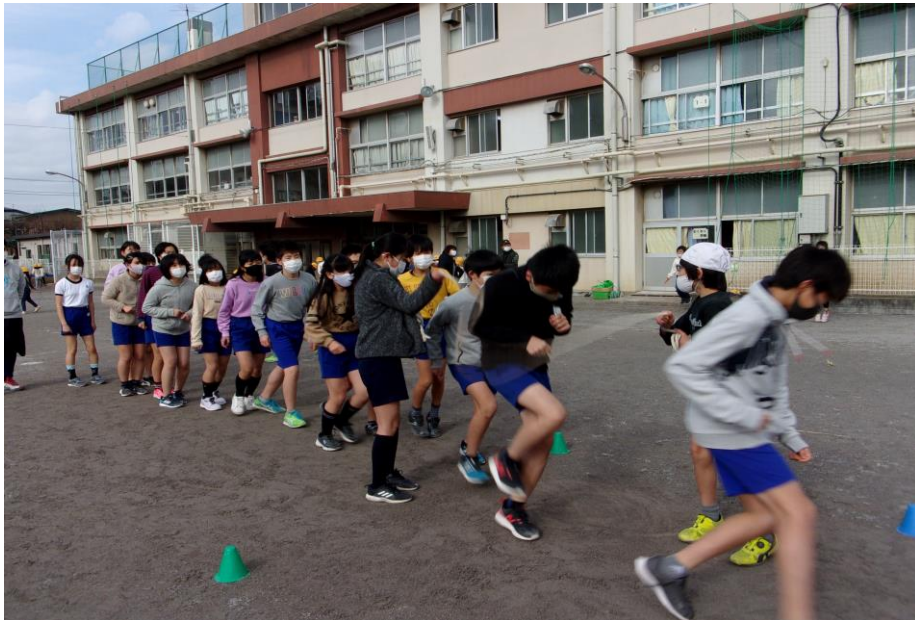
寒さに負けず、長縄に取り組む子供たち