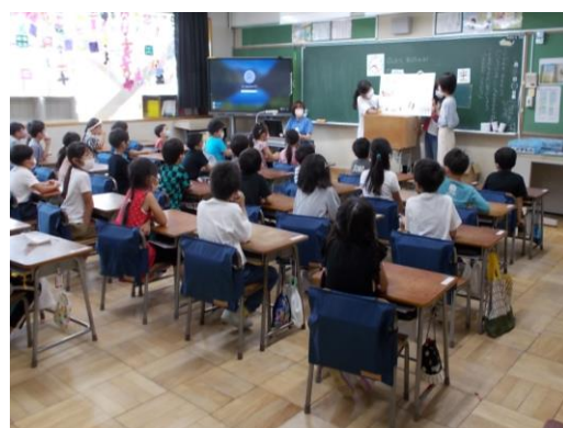
1学期 図書委員会による読み聞かせ

10月24日から11月4日までは、読書旬間です。この期間は、学校でも可能な限り読書時間を設定し、児童の読書活動への意欲向上を図っています。1学期の読書旬間では、図書委員の児童が、1・2年生に本の読み聞かせをしました。また、先日の児童集会では、全校児童にMeetを使用した「オンライン本紹介」を行いました。今年度、1～4年生は年間100冊読むこと、5・6年生は年間1000ページ読むことにチャレンジしています。今は、絵本や児童書より動画に夢中な児童が多いような気がしますが、本でしか味わえない感動もあると思います。子供たちが、これはと思える一冊と出会って、読書の秋を楽しんでくれたらなと願っています。