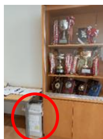
1・2・4年生側昇降口 トロフィー横