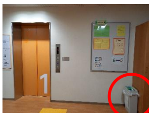
3・5・6年生昇降口 エレベーター横