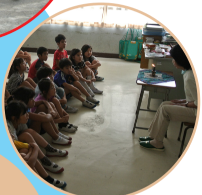
練馬お話の会 の方々