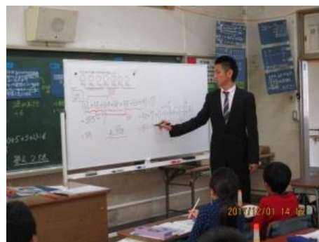
(3校合同の研究授業)