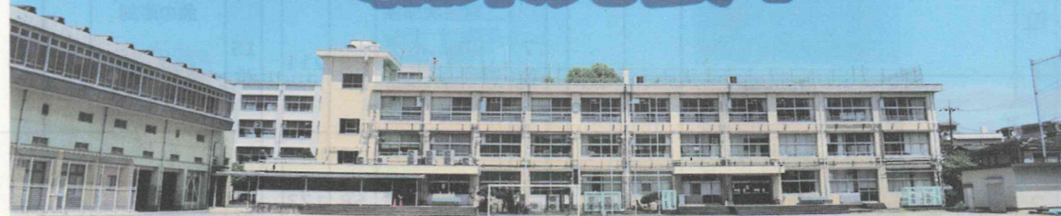
アンケートは旭丘中学校の通学区域である旭丘・小竹地域に配布しました。