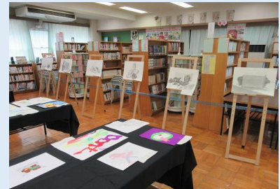
アートクラフト部 (美術部)