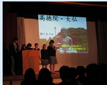
2年鎌倉校外学習のまとめ