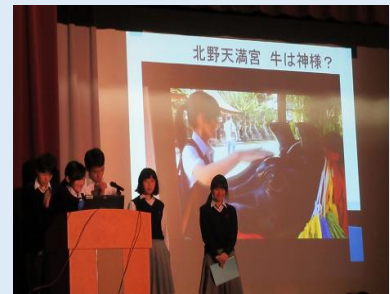
3年修学旅行のまとめ