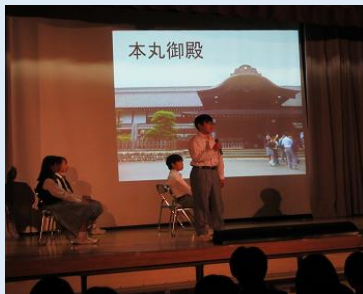
1年川越校外学習のまとめ

事前に調べ学習を行い、興味関心をもって現地に赴き、当日には、調べた内容の確認や新たな発見があります。そして、実施後には、学習したことをまとめます。まとめることで、さらに知識が深まります。各学年とも、素晴らしいプレゼンテーション（発表）ができました。