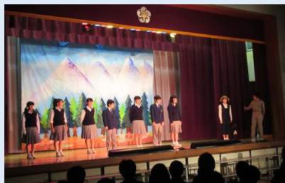
2年英語劇「The sound of Music」