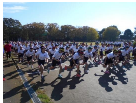
(マラソン大会の様子)