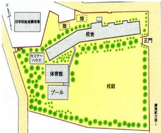
平成24年度 校舎教室配置図