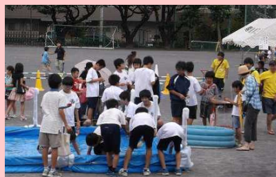
体験型ブースは大人気でした…

7/18(土)に毎年恒例の三涼祭が校庭で行われました。おやじの会の方々や地域の支援を受けて、多くの方々が「お祭り」を楽しみました。開校30周年の大勢参加して、4時間のお祭りはあっという間に過ぎたような気がします。ご協力に改めて感謝申し上げます。