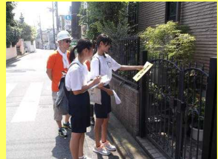
3年生は地域での実地訓練…

した。猛烈な暑さの中、生徒たちは頑張って防災訓練に真剣に取り組んでくれたように思います。