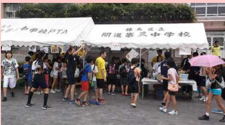
多くの来校者でブースは大繁盛です…

7/18(土)に毎年恒例の三涼祭が校庭で行われました。おやじの会の方々や地域の支援を受けて、多くの方々が「お祭り」を楽しみました。開校30周年の大勢参加して、4時間のお祭りはあっという間に過ぎたような気がします。ご協力に改めて感謝申し上げます。