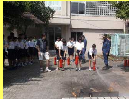
2年生の初期消火訓練の様子…