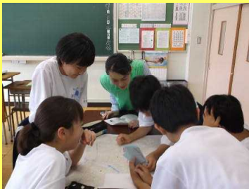
1年生は防災マップ作り…

7/11(土)合同防災訓練を行いました。1年生は教室で地域の防災マップ作成を行いました。2年生は校庭で防災の機材実技訓練、3年生は地域に出かけての情報収集および簡易担架操作訓練をそれぞれ行いました。