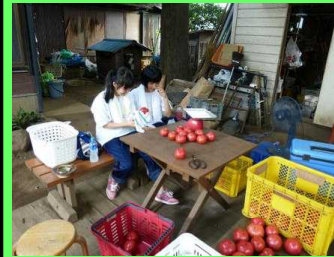
農家での農業体験中…

特に7/27・28の両日に多くの事業所が集中しました。猛暑が厳しく、中学生たちは大変な作業をこなし、大変さや面白さを実感しました。