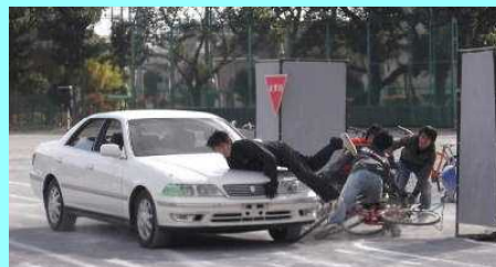
迫力のあるスタントマンの実演です…