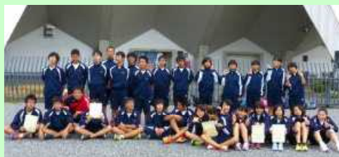
競技を終えて全員での記念撮影です…