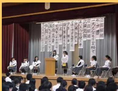
立会演説会の様子です…

10/5(月)に生徒会役員選出のための立候補者による立会演説会が行われました。7名の候補者の演説も応援演説も、制限時間内で个性的で意欲的な話しぶりでした。聴いている生徒たちは、選挙公報を見ながら真剣に立候補者の演説に耳を傾けていました。