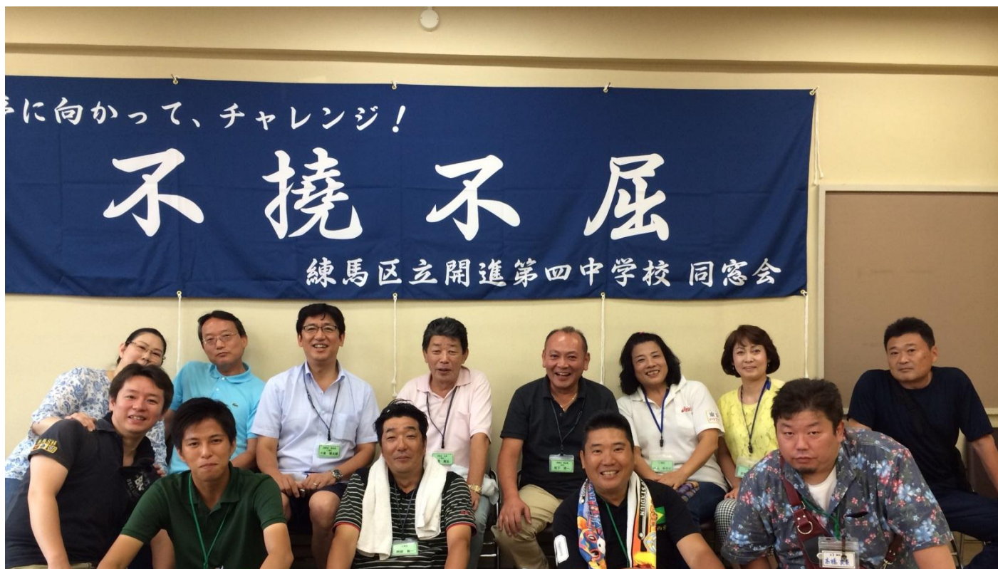
同窓会役員・会員・地域の皆さんです。昨年度に同窓会より寄贈しました横断幕。これからも同窓会を通じて卒業生の交流、学校への支援活動をしていきます。