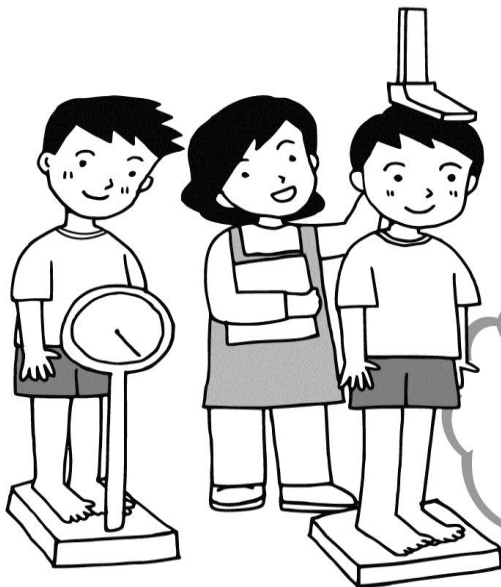
①体がどのように、どのくらい成長したか調べる

毎年行う健康診断にはこんな目的がありますが、理解が十分には進んでいないように感じます。目先のこと、すなわち『結果』のみにとらわれていないでしょうか。確かに結果は大事です。しかし、それを知