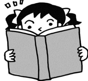
③体について学び、より健康的な生活につなげる

ることから自分の生活を振り返り、今後反映させることが抜けてしまえば、せっかくの健康診断を活かしきれていないと言えます。みなさん自身の未来の土台になるものとして真剣に臨んでほしいと思います。