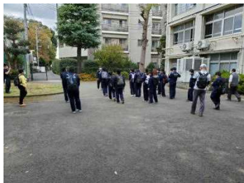
学校出発 約4キロ歩きます