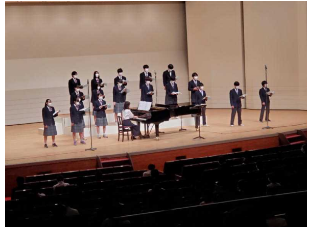
綺麗なハーモニーをありがとう