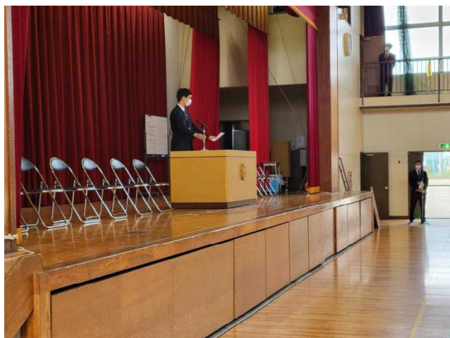
生徒会長の話（1ページに掲載）