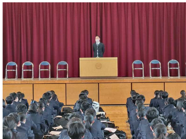
生活指導主任からの話