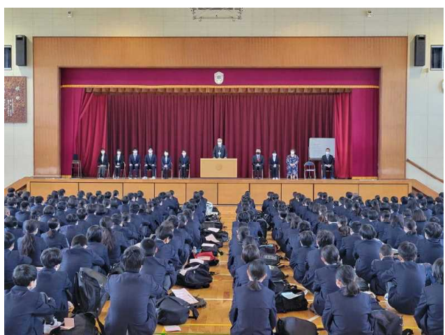
着任式 11名の先生方がいらっしゃいました