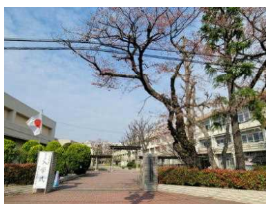
お天気に恵まれました