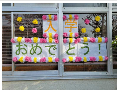
デイサービスセンターの皆様からお祝いメッセージを頂戴しました