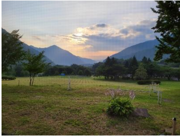
おはようございます。皆元気です。