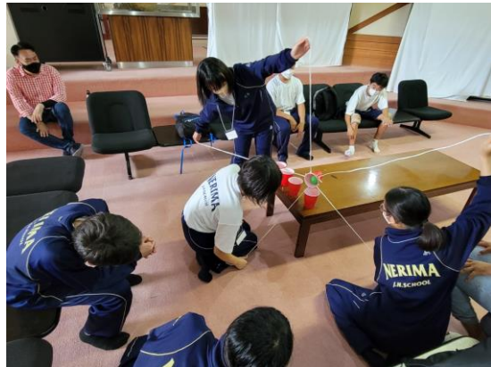
チームの力が試されるアクティビティ 結構難しい