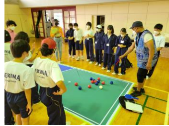
インドアアクティビティ