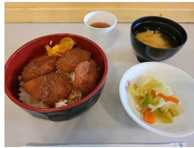
昼食はソースカツ丼