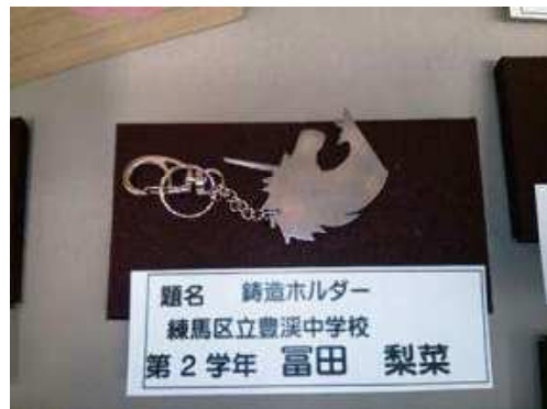
【鑄造キーホルダー】 2年富田 梨菜