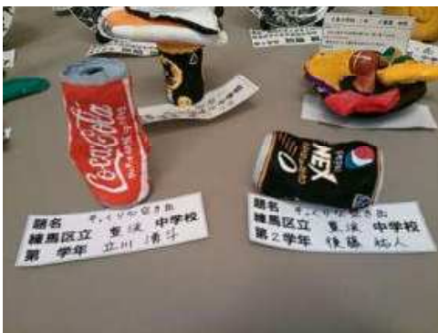
【そっくりな空き缶】 右 2年立川 湧斗 左 2年後藤 祐人