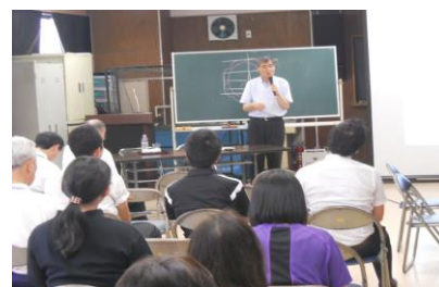
小中合同研究会「特別支援教育」の講演および質疑応答。