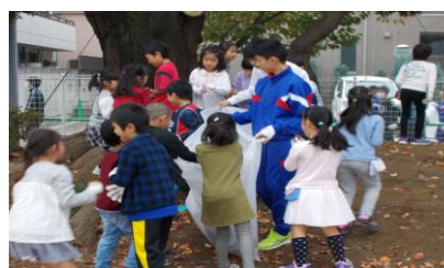
小中合同クリーン運動に参加する中学1年生。