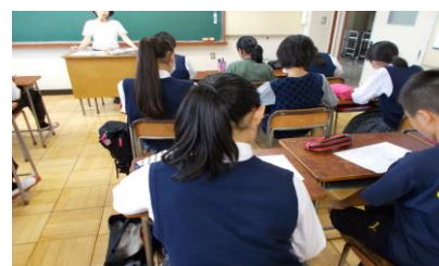
中学校の体験授業に参加している小学6年生