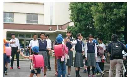
旭町小「あいさつ運動」に参加する中学生