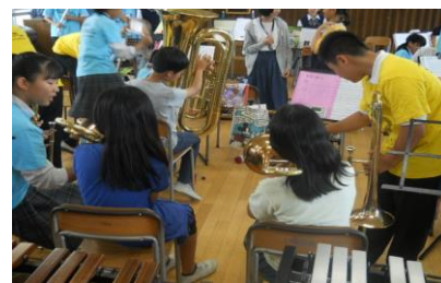
中学校の部活動体験に参加している小学6年生