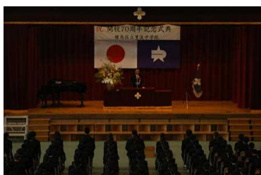
練馬区教育長 河口 浩様