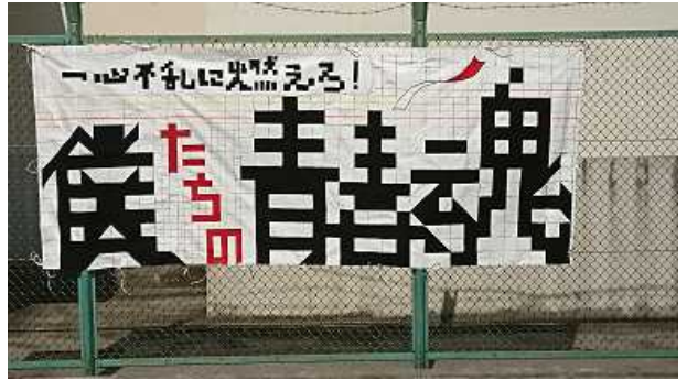
美術部作スローガン

開催に当たり、ご理解、ご支援を頂きました地域の皆様、応援に来て下さいました皆様に、心より感謝申し上げます。