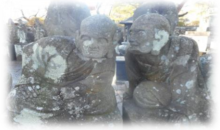
川越 五百羅漢

朝、光が丘駅で班ごとのチェックを受けて出発し、練馬と所沢で乗り換えて本川越駅で班チェック後に、散策を開始しました。途中のチェックは、喜多院・市立博物館・菓子屋横丁の3か所で行いました。