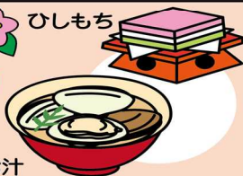
はまぐりのうしお汁

「ひな祭り」の名で親しまれ、桃の花やひな人形を飾り、女の子の健やかな成長を祝います。行事食には、「ちらしずし」「はまぐりのうしお汁」「ひしもち」「ひなあられ」などがあります。