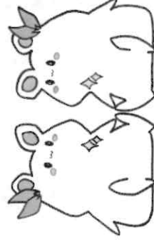
ひかるん&ひかりん