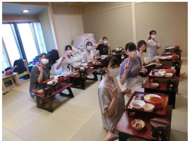
2日目 宿舎での朝食