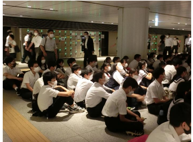
東京駅にて開校式