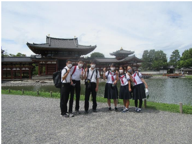
平等院鳳凰堂(宇治)