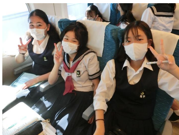
帰りの新幹線内の様子 2