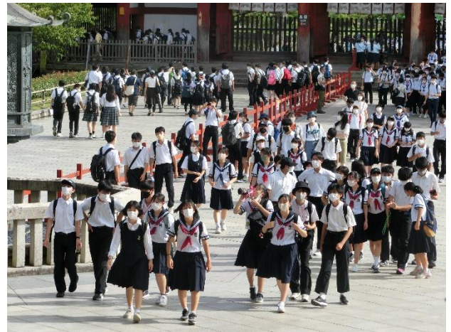
奈良東大寺の様子2