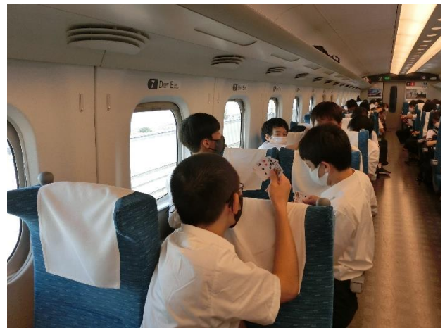
行きの新幹線内の様子