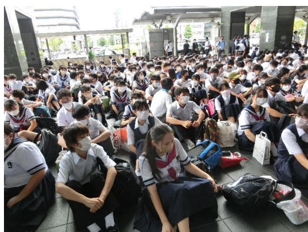
京都駅での閉校式の様子