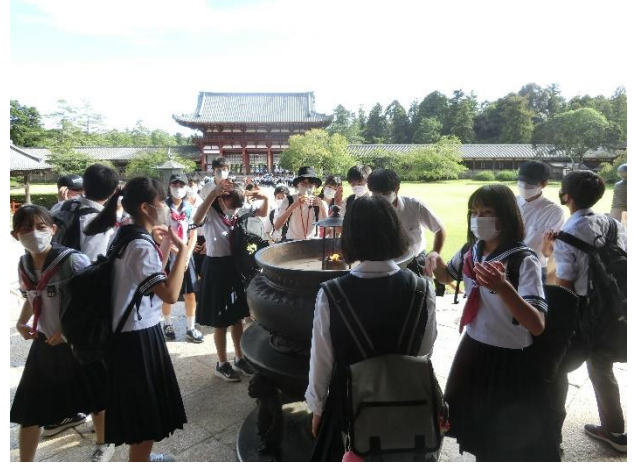
奈良東大寺の様子1