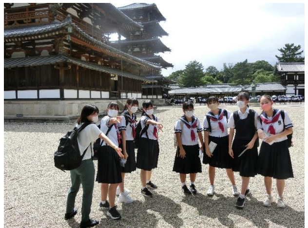
奈良法隆寺の様子