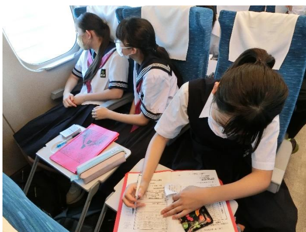
帰りの新幹線内の様子 1