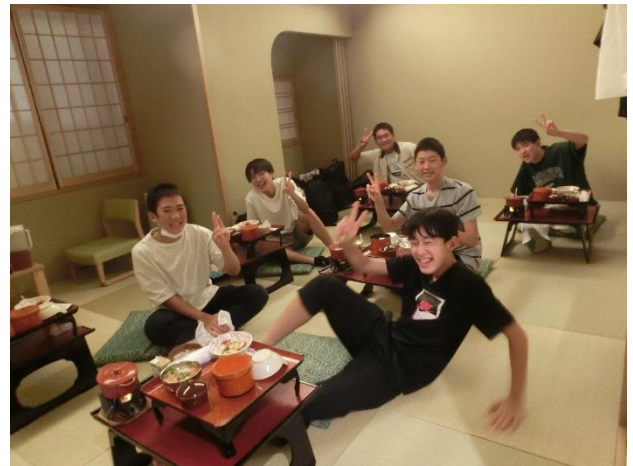
1日目宿舎での夕食