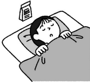
容器を枕元に置いておく