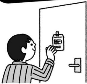
容器をトイレの扉に貼っておく