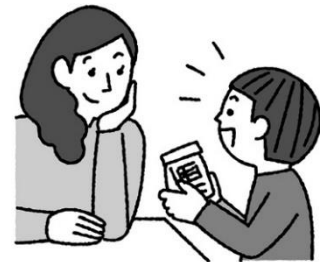
家族の人に話しておく