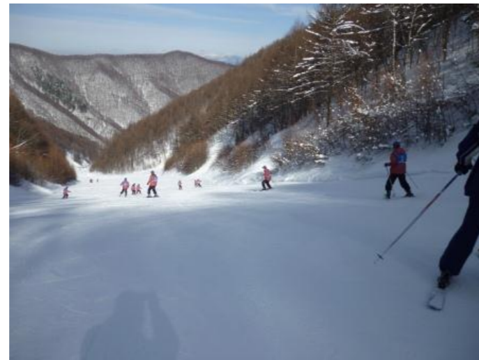
山頂から上手に見えました