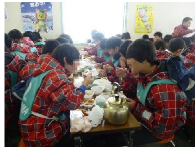
味噌汁おいしいな(昼食)