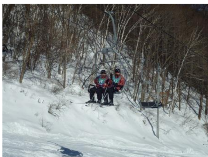
リフトに乗って出発