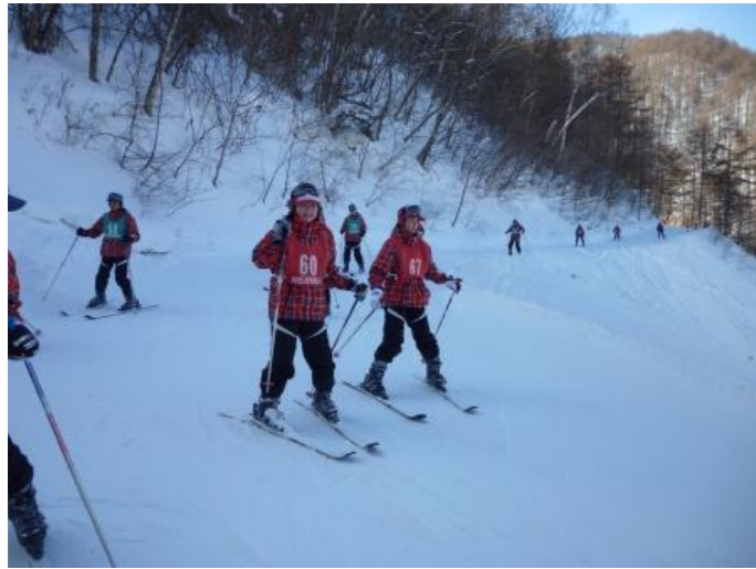
午前の講習終わり