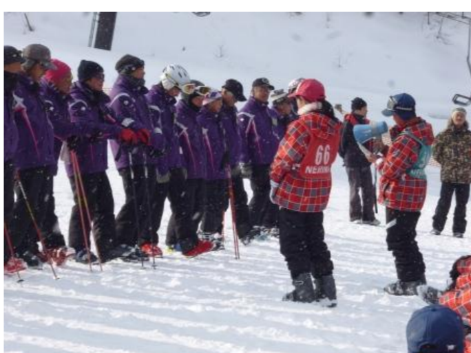
インストラクターの皆さんありがとうございました