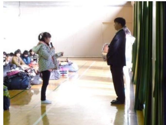
宿舎の方にご挨拶