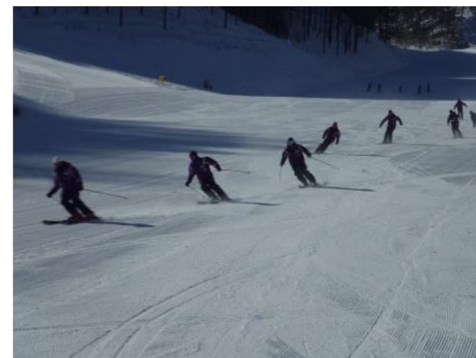
最初はインストラクターのデモンストレーション