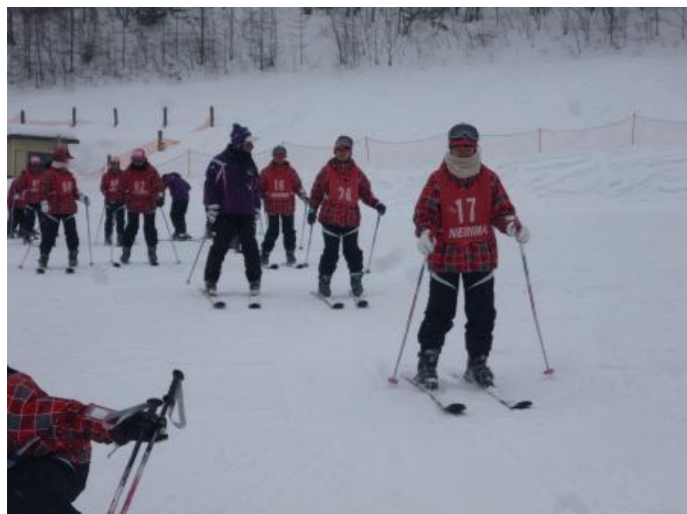
最後の講習終了(お疲れ様)