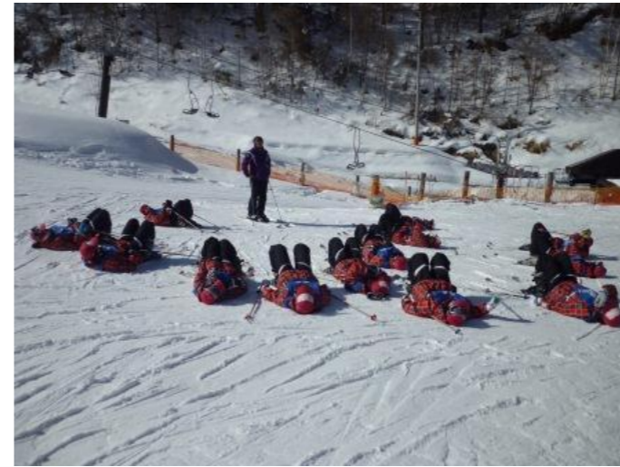
午後の講習は空を見て