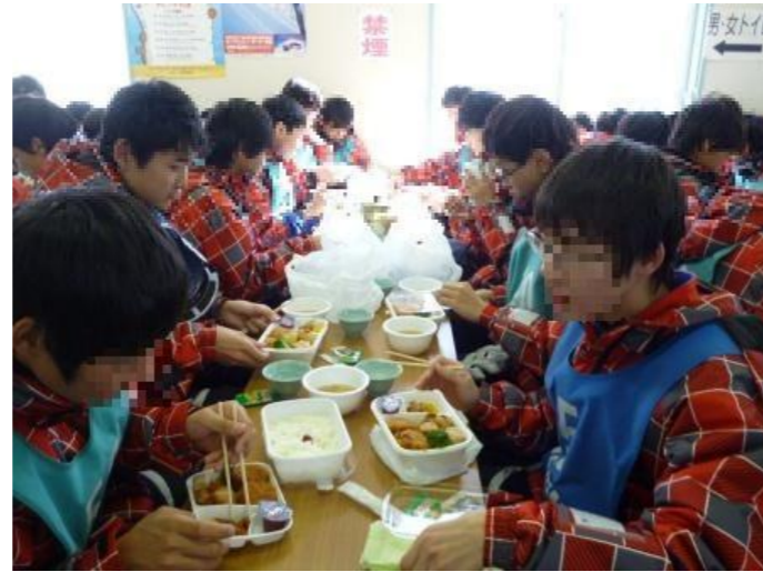
レストハウスでお弁当