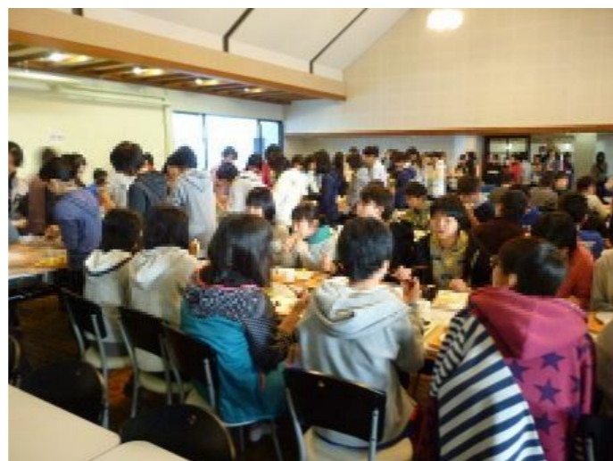
班ごとにいただきます