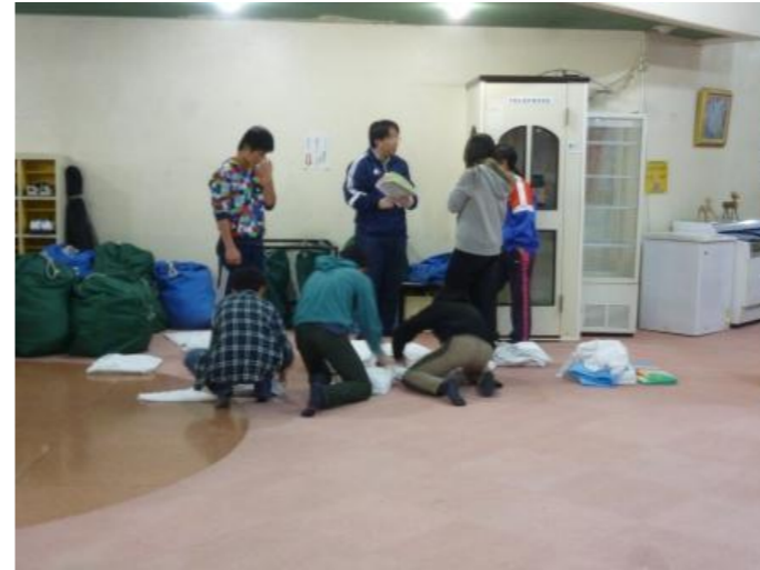
整備係の寝具の回収