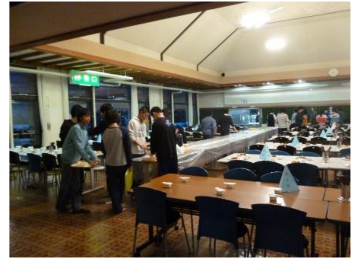
食事係は後片付けを(ご苦労様)