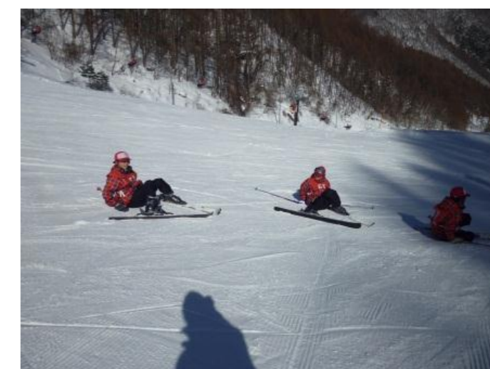
いきなりやっちゃった