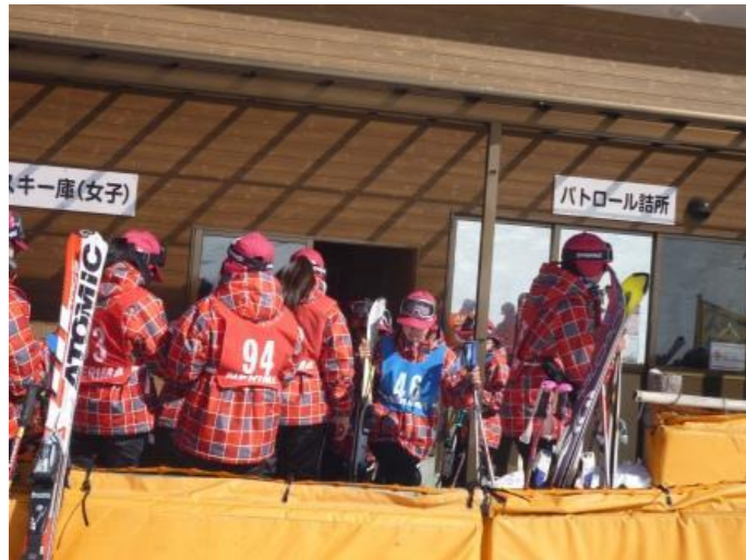
スキー板を借りて