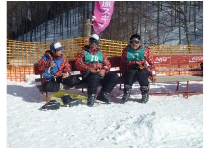
俺たちは見学だよ