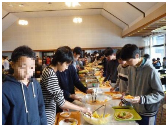
朝食はバイキングで