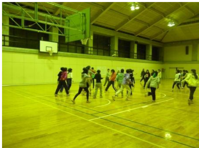
夜はアルティメット大会