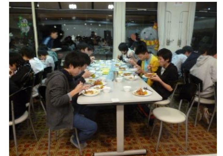
夕食はカレーライス