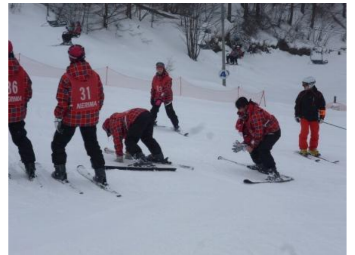
午後も転んでしまっ