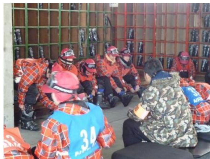
スキー庫でブーツに履き替えて