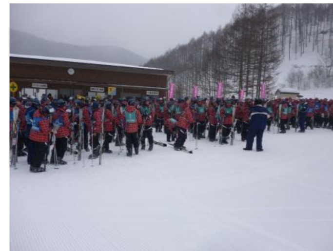
今日は講習最終日