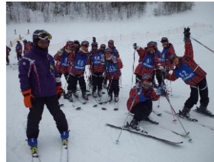
午後の講習終了(楽しかった)