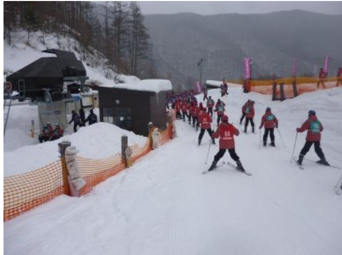
リフト乗り場に向かって