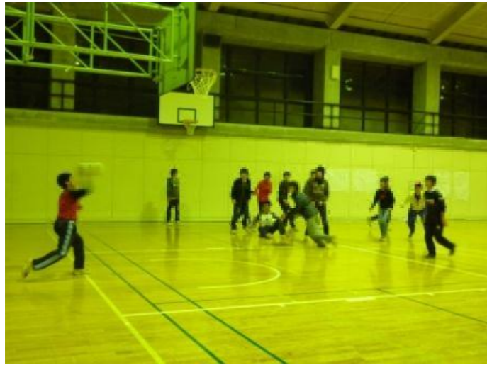
夜はドッチボール大会