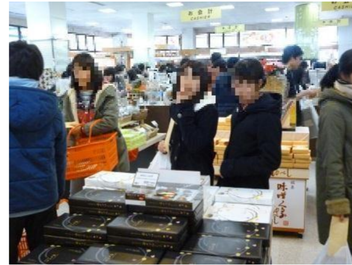
おみやげどれにしようかな？