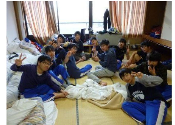
部屋に戻って一休み