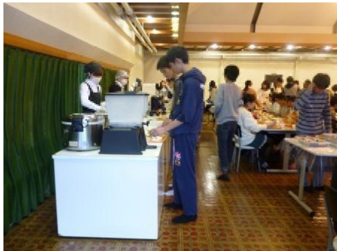
お変わりください