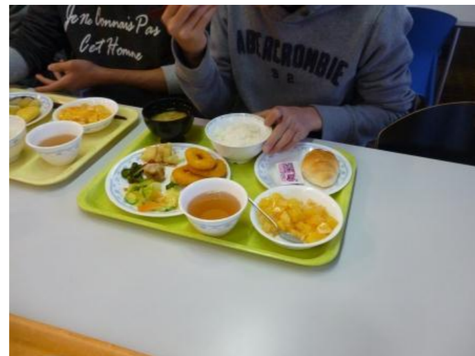
いっぱい食べるぞ