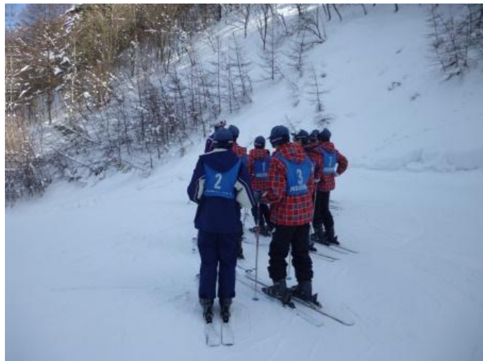
午後は山頂に登って