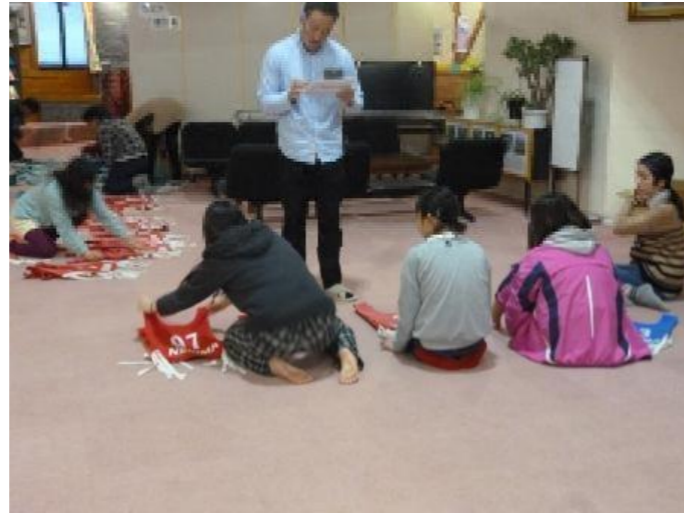
副班長はゼッケンの回収