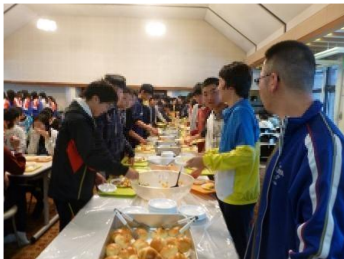
朝食(フルーツヨーグルトおいしそう)