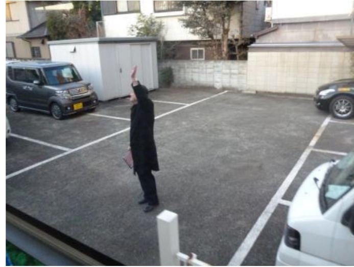
副校長先生たちの見送りを受けて