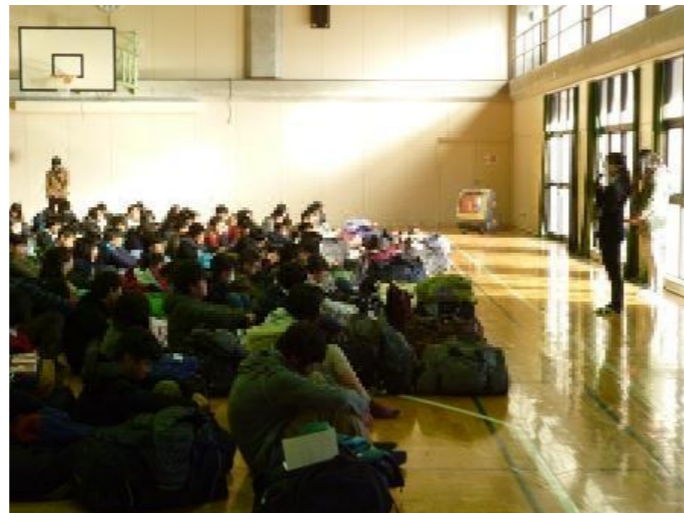
体育館での閉校式