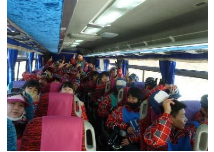
着替えてスキー場へGO