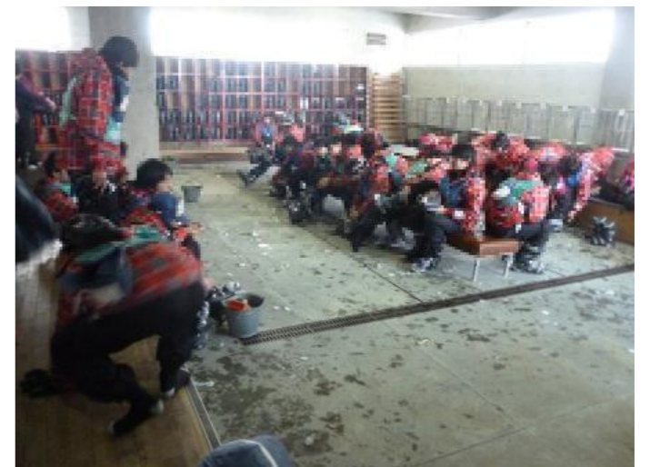
宿に戻って靴を脱いで