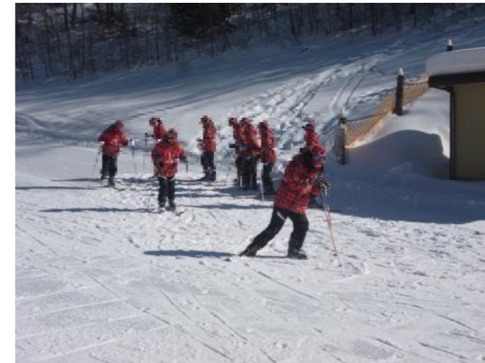
うまく板が履けないぞ