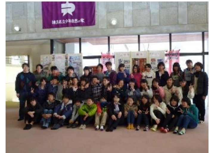
みんなで記念撮影