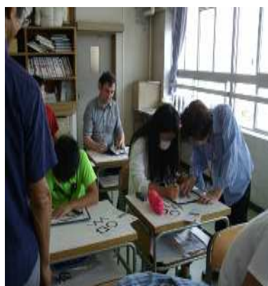
(きりえの授業の様子)

9月26日(火)1年生の美術の授業において、日本きりえ協会の講師の先生をお招きし、きりえの授業の指導をしていただきました。また、JET 青年の留学生もクラスに合流し、一緒に授業を受けました。きりえは和紙を切って形を作るという古くからの技法をルーツとしながら作者の感性や、創造性によって生み出される美術であり、日本で生まれた世界に誇る文化だそうです。生徒や留学生だけでなく先生方も夢中になりながら、作品作りに没頭していました。