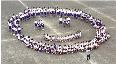
↑左下が少し内側に入ると良いかな?

先週は雨で体育館での学年練習となりましたが、15日(木)は校庭で実施することが出来ました。初めて6クラスでマスゲームを合わせましたが、なかなか上手で驚きました。リレーも各クラスで走順を決めて一生懸命取り組んでいます。まだまだバトンパスは改善すべきところも多いですが、その分今後の成長が楽しみです。2年生・3年生のように素早くカッコいいバトンパスを目指して頑張ってください。石神井西中のリレーはバトンパスが上手いので有名ですから。