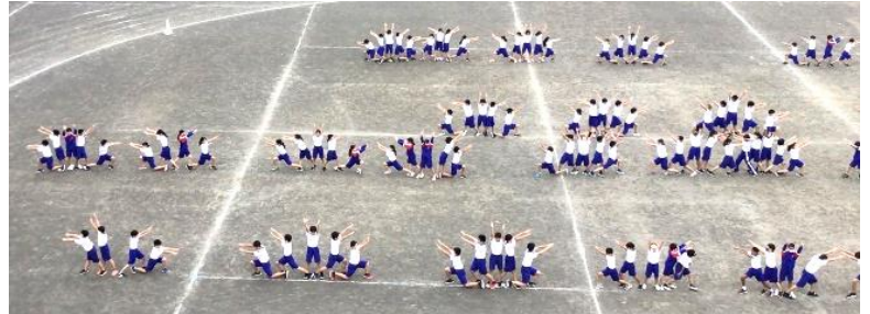
↑指先まで力が入って綺麗ですね。