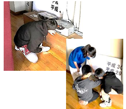
↑音楽編集も自分たちでやります。 音響係が頑張りました。