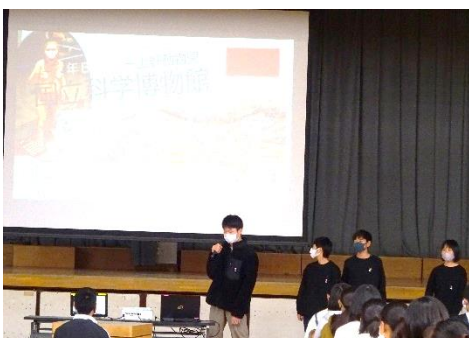
←工夫されたスライドで楽しませてくれました。