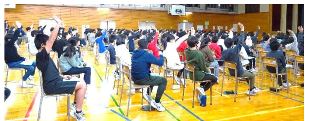
↑プレゼンの途中ではクイズを出したり、見ている人を飽きさせない工夫がたくさんありました。