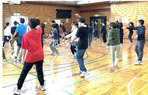
↑何度も繰り返し練習しています。