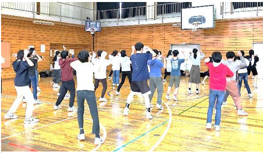
↑みんなで楽しそうに踊っています。

ついに明日はダンス発表会本番です。体育の授業や面談期間中の時間を使って、一生懸命練習してきました。体育委員や各グループリーダーを中心に、みんなで協力して取り組めたと思います。例年、もっとダンスを作る段階で苦戦するのですが、今年はみんながとても積極的に取り組んでくれたのでどのクラスも完成が早かったです。面談期間中の練習では、楽しそうに踊る1年生の姿がありました。なぜか体育の授業よりも汗びっしょりになっている人が多かったです。