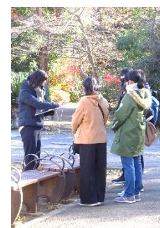
校外学習で学んだ事