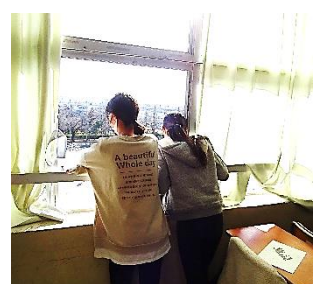
↑校庭の様子を見るのって結構楽しいです。