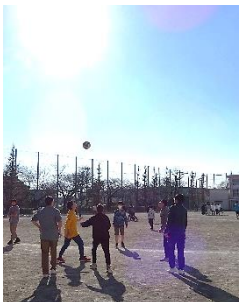
↑バレーをするバスケット部の人たち。

昼休みの20分間は、みんな好きなことをして過ごしています。寒さに負けず外や体育館で遊ぶ人たち、図書室で本を読む人たち、教室から校庭を眺めたり、おしゃべりをしたり、まったりしたり、それぞれの昼休みを過ごしています。こういう時間ってとても大切だなと感じます。