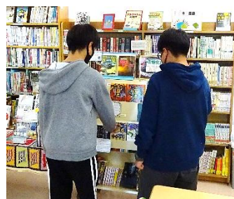
↑図書室で本を探しています。