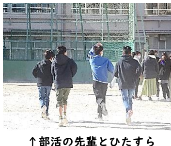
↑部活の先輩とひたすら走っています。