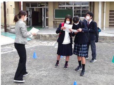
↑クラス発表を見て、自分の名前を必死に探すみなさん。

6日(火)の朝は皆さん少し興奮気味で登校してきました。ドキドキしながらクラス発表のプリントを覗いていました。その後は落ち着いて体育館で始業式、新クラスで学活をしました。その後、明日の入学式に向けて準備をしてくれた生徒が多くいました。部活動や委員会で仕事をしてくれた人や、教科書の運搬を率先してやってくれた人がたくさんいました。去年は自分たちのために2・3年生がこんなにやってくれたのだと実感したと思います。