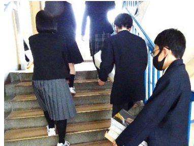
↑重い教科書を抱えて1階から4階まで何往復もしてくれました。ありがとう。