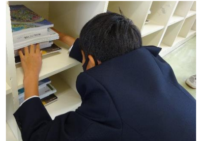
↑きちんと教科書が揃っているか最終チェックをしてくださいました。