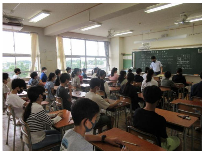
定期テスト直前の様子