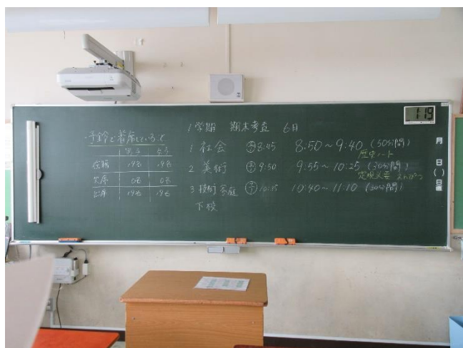
定期考査時の黒板