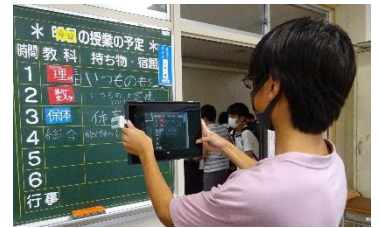
↑日直が連絡黒板をクラスルームにアップしてくれます。