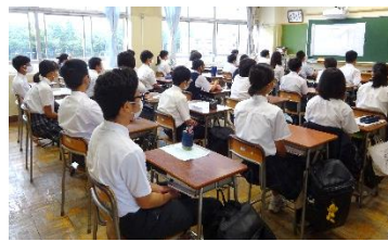
↑落ち着いたオンライン始業式に臨んでいます。

の2点です。①は、体調チェックを登校前に必ず行うようにする目的とコロナ感染症対策の一環としてプリントのやりとりを減らすという目的があります。②は、みんなが連絡帳を書かなくて良いようにするためではありません。今後、様々な理由で欠席する場合も増えてくるかもしれないので、欠席した人が翌日の連絡や持ち物を分かるようにするためです。なので、連絡帳の記入は続けてください。以上の2点やオンライン学習などさまざまなことが新しく始まっている2学期です。しばらくはうまくいかない部分もあるかもしれませんが、お試し期間と考えていただき、うまくいく方法を一緒に見つけてくれると嬉しいです。