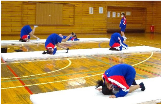
これは何をしているかと言うと

保健体育の授業では、マット運動を行っています。クロームブックを活用して、自分の演技を動画に撮ったりしながら取り組んでいます。ご家庭でも見せてもらってください。自分に適した技を選択し、複数の技をつなげて発表します。みんな一生懸命取り組んでいます。