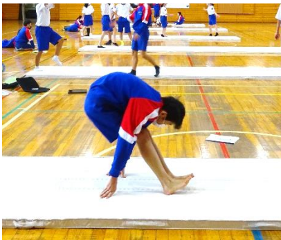
←これは伸膝前転（しんしつぜんてん）と言って難易度 MAX の技。学年でできたのは、2人程だったような。