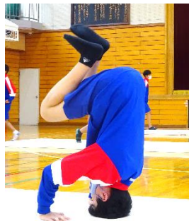
このようにバランスをとりながら足を上げて